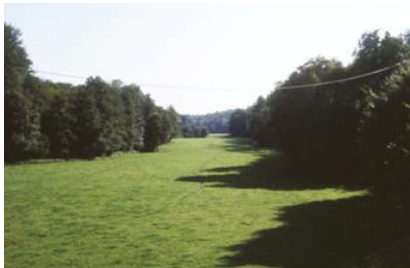
Le fond plat de la vallée de la Solre à la Foulerie (Solrinnes).