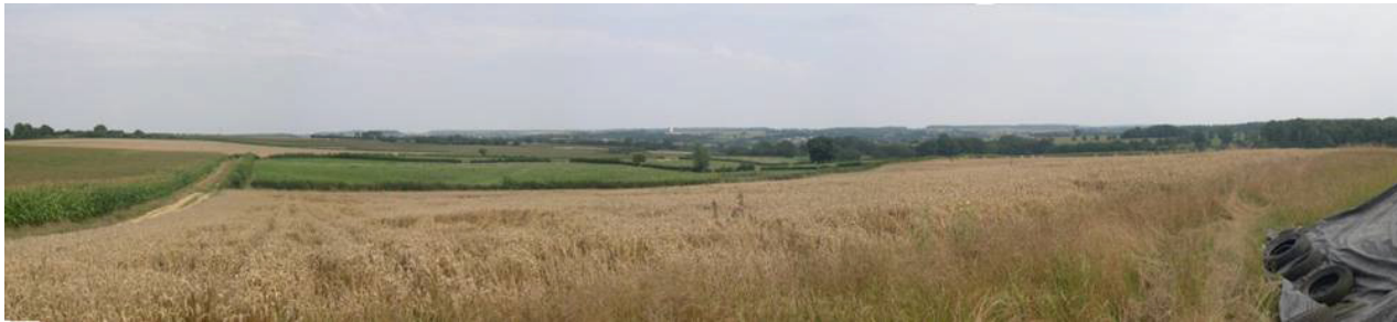
La petite dépression herbagée et bocagère du ruisseau de Glarge. A l'horizon, les boisements de la Fagne de Solre.