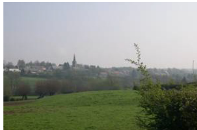
La silhouette du village d'Obrechies domine la vallée de la Solre à la confluence du ruisseau de la Carnoye, dans une ambiance bocagère.