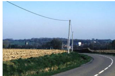
Le village d'Aibes et les bois à l'horizon.