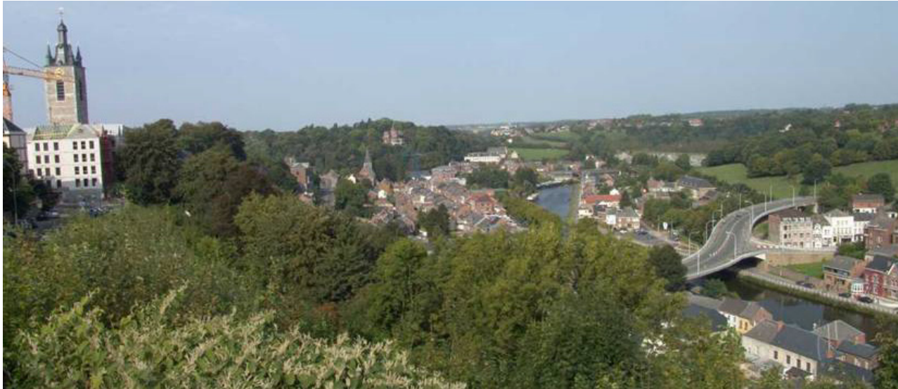
Le beffroi et la Ville-Basse à Thuin