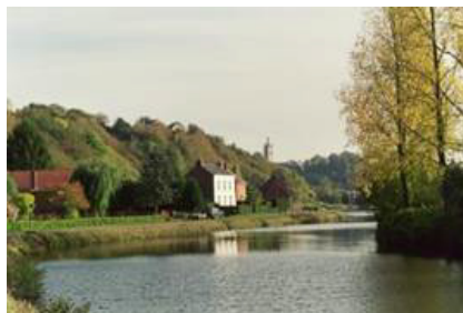
La Sambre entre Lobbes et Thuin