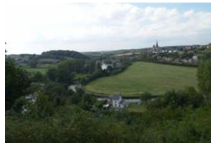
Lobbes et sa Collégiale